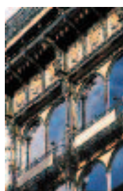
Old England, 1899, parons Georges de la Cour, Arch. Paul Godeaux.