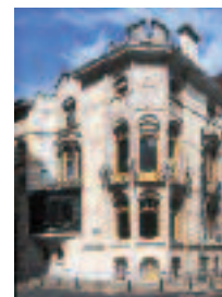
Maison Husson, 1905, parons de la Cour, Arch. Jules Brunelle.